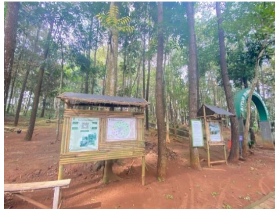
Gambar 2. Papan Informasi Tahura Gunung Palasari