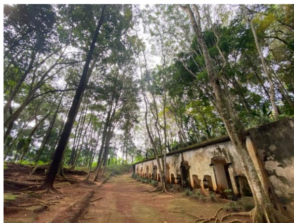
Gambar 3. Banguna bersejarah Tahura Gunung Palasari

Tahura Gunung Palasari ini menjadi objek wisata yang menonjolkan keindahan khususnya suasana hutan terawat dengan dominasi pohon pinus yang sangat indah untuk dinikmati wisatawan sebagai wisata edukasi. Wisatawan akan banyak diberikan pengetahuan baru mengenai tanaman yang ada di Tahura Gunung Palasari yang dapat diakses dengan cara memindai barcode yang ada di dalam papan informasi. Informasi ini dapat menjadi sarana edukasi yang dapat dipelajari setiap wisatawan yang berkunjung dengan mudah dan dapat diakses menggunakan internet (Rahmad et al., 2023). Dengan adanya link barcode tersebut wisatawan bukan hanya dapat mengetahui tentang jenis tanaman dan asal usulnya melainkan juga informasi lain seperti sejarah berdiri dan media sosial Tahura Gunung Palasari. Sehingga Keindahan alam dan Tumbuhan yang ada didalamnya menjadi objek wisata edukasi dan termasuk pada kategori kekuatan (Strength) Pada hasil analisis SWOT.