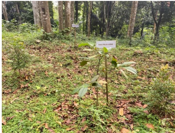
Gambar 4. Penanaman pohon di Kawasan Tahura Gunung Palasari

Gunung Palasari. Wisatawan yang berkunjung akan diberikan pengetahuan mengenai bangunan bersejarah tersebut yang biasanya dibantu oleh pengelola yang merupakan warga lokal mengenai sejarah bangunan tersebut. Selain mempelajari sejarah bangunan tersebut juga sering menjadi objek foto bagi wisatawan yang sangat iconic di Tahura Gunung Palasari. Sehingga selain berwisata edukasi wisatawan juga dapat mengabadikan momen dengan ojek objek photo yang bernilai sejarah di Tahura Gunung Palasari.