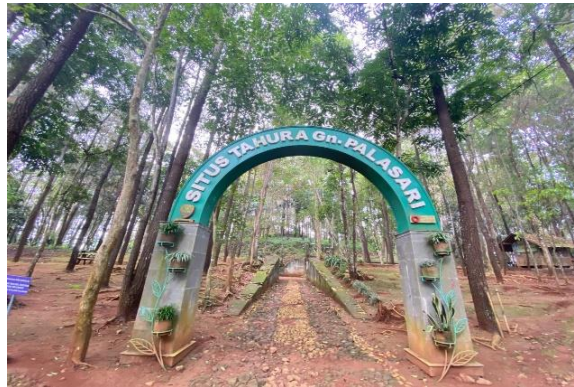
Gambar 1. Tahura Gunung Palasari