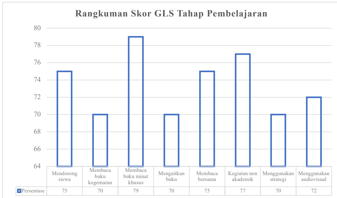
Gambar 3. Rangkuman Skor GLS Tahap Pembelajaran

Kegiatan literasi pada tahap pembelajaran diukur menggunakan 8 (delapan) indikator yang divisualisasikan pada Gambar 3 berikut.