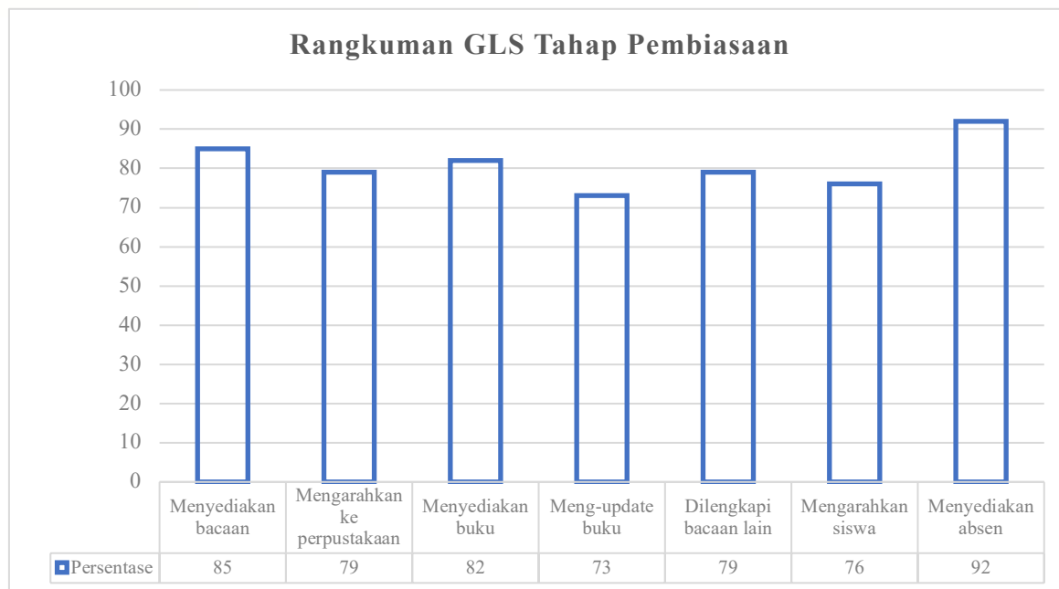
Gambar 1. Rangkuman Skor GLS Tahap Pembiasaan

Merujuk pada Gambar tersebut, terlihat beberapa aktivitas yang mendukung Program GLS khususnya pada tahap pembiasaan di lingkungan sekolah. Secara rinci, masing-masing indikator dari skor tertinggi ke terendah diuraikan sebagai berikut. Indikator menyediakan absen menunjukkan angka tertinggi, yaitu 92%, indikator menyediakan bacaan menempati posisi kedua dengan persentase 85%, dan indikator menyediakan buku juga memperoleh angka tinggi, yakni 82%. Selanjutnya, indikator mengarahkan ke perpustakaan dan indikator dilengkapi bacaan lain masing-masing memperoleh skor 79%, indikator mengarahkan siswa memperoleh skor 76%, serta indikator meng- update buku, memiliki nilai terendah, yakni 73%. Secara keseluruhan, data pada Gambar 1 menunjukkan bahwa sekolah sudah cukup baik dalam mendukung pelaksanaan GLS, terutama dalam aspek administrasi dan ketersediaan bahan bacaan. Namun demikian, terdapat kekurangan pada aspek pembaruan koleksi buku yang perlu menjadi perhatian utama dalam penguatan literasi siswa.