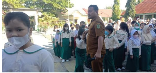
Gambar 7. Siswa sedang berjabat tangan dengan guru

memberi salam kemudian berjabat tangan dengan guru yang ada dikelas. Seperti yang terlihat pada gambar berikut.