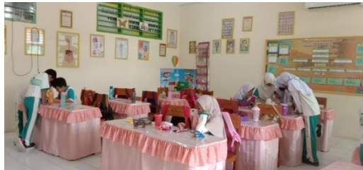
Gambar 3. Siswa sedang melihat idolanya di handphone

Selain itu terlihat siswa sedang meniru wajah idolanya (Chaplin) dan mengajak gurunya berfoto. Disisi lain terlihat siswa sedang meniru gaya idolanya bernyanyi.