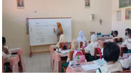
Gambar 2. Salah satu siswa sedang bertanya dan guru menjelaskan

Dari hasil wawancara dengan seorang informan beliau mengemukakan bahwa: