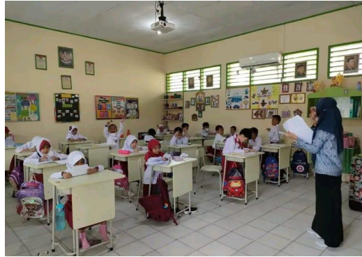
Gambar 5. Guru sedang memberikan amanat kepada siswa agar tidak memberikan jawaban

yang diberikan oleh guru terhadap siswa yakni berupa amanat yaitu siswa diminta untuk tidak saling berbagi jawaban apabila diberi tugas individu.