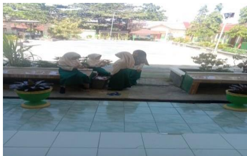
Gambar 1. Siswa sedang berkomunikasi

Berdasarkan hasil observasi dalam berkomunikasi diketahui bahwa siswa kelas tinggi terdiri dari beberapa suku sehingga terdapat beberapa gaya bahasa yang berbeda. Perbedaan gaya bahasa dalam berinteraksi mempengaruhi mudah atau sulitnya individu dalam menyampaikan ide atau informasi kepada komunikan atau penerima.