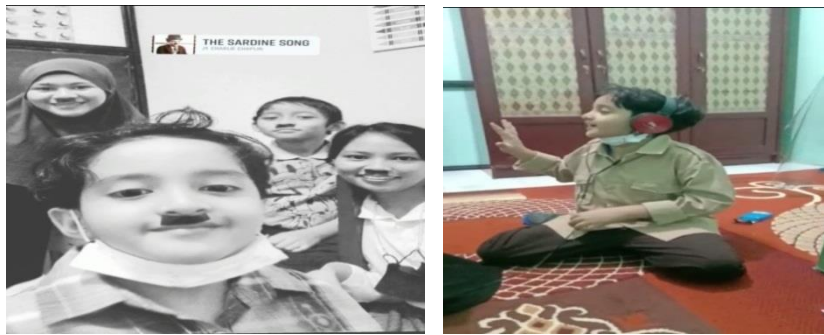
Gambar 4. Bentuk imitasi siswa (meniru idolanya)

Selain itu terlihat siswa sedang meniru wajah idolanya (Chaplin) dan mengajak gurunya berfoto. Disisi lain terlihat siswa sedang meniru gaya idolanya bernyanyi.