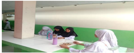
Gambar 8. Siswa sedang berbagi bekal dan makan bersama

Selanjutnya berdasarkan hasil wawancara dengan seorang informan beliau mengemukakan bahwa: