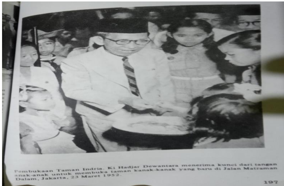
Gambar 5. Ki. Hadjar Dewantara Menyerahkan Kunci

Dengan melihat foto di atas kita beroleh nuansa bahwa Ki Hadjar Dewantara dengan gayanya yang khas mengenakan kacamata dan peci sembari menerima secara simbolik kunci yang diserahkan oleh seorang anak. Begitupun jika kita cermati, di samping kanan Ki Hadjar Dewantara ada seorang anak yang turut menyaksikan prosesi itu. Ini adalah moment pembukaan Taman Indria pada tahun 1952.