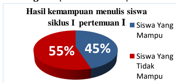
Diagram presentase kemampuan menulis siswa siklus I pertemuan I

Sementara untuk hasil menulis siswa pada siklus I pertemuan I dapat dilihat bahwa hasil tes akhir kemampuan menulis kata benda Bahasa Gorontalo pada pertemuan I masih dalam ketegori kurang, Pelaksanaan tindakan kelas ini bisa dinyatakan berhasil apabila >75% dari keseluruhan siswa memperoleh nilai ketuntasan minimal yakni 75% namun, pada pertemuan I dari 20 siswa hanya ada 9 siswa atau 45% yang sudah mampu menulis kata benda Bahasa Gorontalo dan sisanya 11 siswa atau 55% yang belum mampu menulis kata benda Bahasa Gorontalo. Dengan demikian dapat disimpulkan bahwa penggunaan model Consept Sentence pada proses pembelajaran perlu di lanjutkan pada petemuan II. Hasil menulis siswa pada siklus I pertemuan I dapat dilihat pada diagram berikut ini