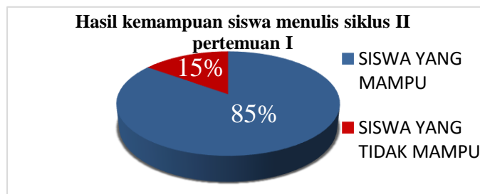
Diagram 4.3 presentase kemampuan menulis siswa siklus II pertemuan I.

besar dari indikator capaian yang sudah di tentukan yakni mencapai 85%. Hasil kemampuan siswa menulis kata benda dalam Bahasa Gorontalo dapat dilihat pada diagram di bawah ini.