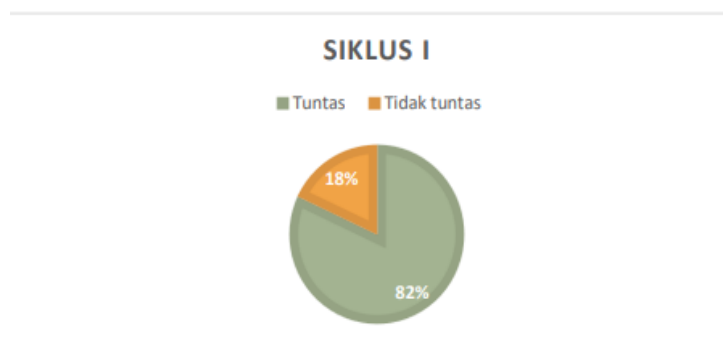
Gambar 2. Diagram Siklus I

XI IKM C tercatat 28 siswa yang mengerjakan tes yang telah diberikan terdapat sebanyak 23 siswa yang mencapai KKM dan tercatat sebanyak 5 siswa yang belum mencapai KKM.