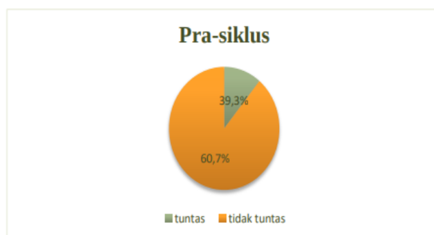
Gambar 1. Diagram prasiklus

Dapat diketahui kemampuan membaca siswa kelas XI IKM C melalui tes pra siklus, peneliti akan memperbaiki dan meningkatkan kemampuan membaca siswa kelas XI IKM C. Hasil tes pra siklus digunakan sebagai acuan untuk melakukan perbaikan pembelajaran. Peneliti setuju akan menetapkan penggunaan metode CIRC pada kegiatan pembelajaran membaca.