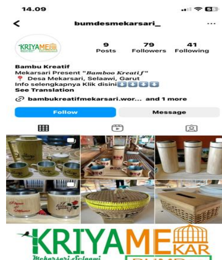
Gambar 2. Dokumentasi Penulis, 2023

Diketahui bahwa beberapa pengrajin kerajinan bambu di Desa Mekarsari Kecamatan Selaawi memilih platform e-commerce besar seperti Tokopedia, Shopee, dan Lazada, serta mencoba eksplorasi di platform media sosial seperti Instagram dan Tiktok sebagai alat pemasaran produk kerajinan bambu. Meskipun mereka masih dalam tahap pembelajaran, hal ini mencerminkan komitmen dari pengrajin untuk memahami dan memanfaatkan potensi dari berbagai platform pemasaran digital.