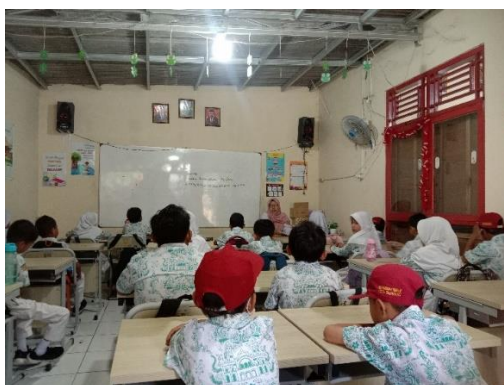
Gambar 1. Pelaksanaan Kegiatan Observasi

Menurut data penelitian yang sudah dilaksanakan di kelas 2 SDN Pedurungan Tengah 01, menunjukkan guru belum mengimplementasikan pembelajaran diferensiasi ketika melakukan pembelajaran, padahal pendekatan diferensiasi ini penting untuk mengakomodasi kebutuhan peserta didik. Sebelum menerapkan pembelajaran diferensiasi, guru perlu untuk memahami karakteristik peserta didik, salah satunya yaitu gaya belajar mereka yang menggambarkan upaya seseorang untuk menangkap serta memproses sebuah penjelasan dari informasi yang didapatkan. Guna memetakan gaya belajar tersebut dilakukan pemberian angket kepada peserta didik, berikut adalah angket yang diberikan kepada peserta didik.