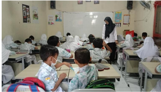
Gambar 3. Peserta Didik Mengisi Angket Gaya Belajar

Angket tersebut berfungsi untuk membantu dalam memetakan kebutuhan belajar dari peserta didik kelas 2. Setelah memperoleh data, kebutuhan belajar peserta didik dikelompokkan sesuai dengan jenisnya untuk memudahkan dalam menganalisis data. Berdasarkan data yang diperoleh, menunjukkan bahwa sebanyak 12 orang peserta didik cenderung belajar melalui visual, kemudian 11 orang peserta didik belajar secara auditori, dan 4 orang lainnya belajar dengan cara kinestetik. Dengan demikian, dapat diketahui bahwa jumlah persentase (%) gaya belajar peserta didik kelas 2 SDN Pedurungan Tengah 01 disajikan pada gambar diagram berikut.