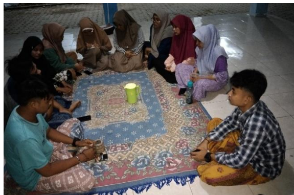
Gambar 1. Musyawarah penentuan materi bimbingan belajar untuk meningkatkan kecakapan ibadah.

Pada tahap ini kami mulai merancang konsep bimbingan belajar yang akan kami laksanakan berdasarkan hasil data yang kami peroleh. Perencanaan diawali dengan musyawarah untuk menentukan sasaran bimbel, waktu pelaksanaan, tempat pelaksanaan, dan materi pembelajaran yang akan diajarkan nantinya. Bimbingan belajar ini untuk anak usia TK-SD, dan pelaksanaannya dua kali pertemuan pada minggu kedua yang bertempat di Balai Desa Tentenan Barat. Materi pembelajaran yang kami berikan yaitu tentang ibadah sholat seperti syarat-syarat shalat, rukun shalat, dan lainnya yang termaktub dalam selebaran.