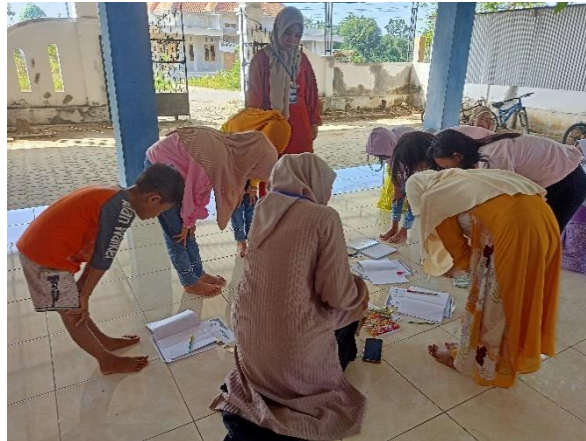
Gambar 3. Pelaksanaan bimbingan belajar bacaan dan praktek shalat menggunakan metode demonstrasi

Pada pelaksanaan bimbingan belajar bacaan dan praktek sholat guna meningkatkan kecakapan ibadah kami memberikan selebaran yang berisi materi tentang sholat. Pada pertemuan pertama kami menjelaskan terlebih dahulu tata cara sholat yang benar mulai dari berwudlu, niat sholat, syarat-syarat sholat, dan rukun sholat. Selanjutnya kami memperagakan gerakan sholat disertai bacaannya dan menginstruksikan kepada anak bimbingan untuk mengikuti gerakan kami. Pada waktu anak mempraktekkan, pada saat itu juga kami mengoreksi gerakan dan juga bacaan sholat mereka. Sehingga mereka langsung bisa mengetahui apa yang salah dari bacaan dan gerakan shalatnya. Kegiatan ini berlangsung khidmad dan anak-anak mengikutinya dengan penuh semangat dan antusias. Berikut tabel penilaian kecakapan ibadah anak dari bacaan dan gerakan shalatnya.