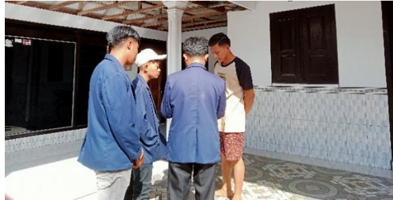
Gambar 2. Pemberitahuan informasi kepada masyarakat akan dilaksanakannya bimbingan belajar di Balai Desa Tentenan Barat

Langkah selanjutnya, kami cetak brosur dan mulai menyebar brosur ke kepala dusun sekaligus sosialisasi ke masyarakat sebagai pemberitahuan bahwa kami dari mahasiswa KPM akan mengadakan bimbingan belajar yang bertempat di balai desa.