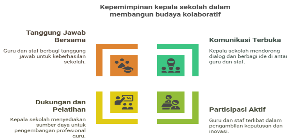
Gambar 3. Kepemimpinan kepala sekolah dalam membangun budaya kolaboratif di SDN 88 Barru