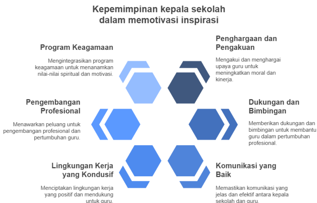
Gambar 1. Kepemimpinan kepala sekolah dalam memotivasi inspirasi di SDN 88 Barru

Motivasi adalah proses yang dilakukan oleh kepala sekolah untuk meningkatkan semangat, antusiasme, dan kinerja guru dalam melaksanakan tugasnya. Motivasi ini dapat dilakukan melalui berbagai cara, seperti: penghargaan atau pengakuan, dukungan dan bimbingan, komunikasi yang baik, lingkungan kerja yang kondusif serta pengembangan profesional. Berdasarkan hasil wawancara, kepala sekolah berperan aktif dalam memberikan motivasi kepada guru melalui dukungan moral, apresiasi, dan pemahaman bahwa mengajar adalah bagian dari ibadah. Hal ini menciptakan semangat dan keikhlasan dalam mendidik siswa. Selain itu, program keagamaan seperti Sholat berjama'ah juga menjadi sarana pembinaan yang memperkuat motivasi guru dalam membimbing siswa, baik dari segi akademik maupun spiritual. Kepala Sekolah. berperan sebagai sumber motivasi inspiratif bagi guru dan siswa dengan menanamkan nilai-nilai spiritual serta mendorong inovasi dalam pembelajaran. Melalui teladan dalam ibadah, dukungan moral, dan apresiasi, kepala sekolah membangun lingkungan kerja yang positif, di mana guru merasa dihargai dan lebih termotivasi dalam menjalankan tugasnya. Program keagamaan seperti shalat berjamaah tidak hanya menjadi bagian dari budaya sekolah tetapi juga berfungsi sebagai pembinaan bagi guru, maka hal ini terbukti efektif dalam mengoptimalkan semangat mengajar dan kualitas pendidikan di SD Negeri 88 Barru. Untuk lebih jelas hasil penelitian dapat dilihat pada gambar 1 berikut: