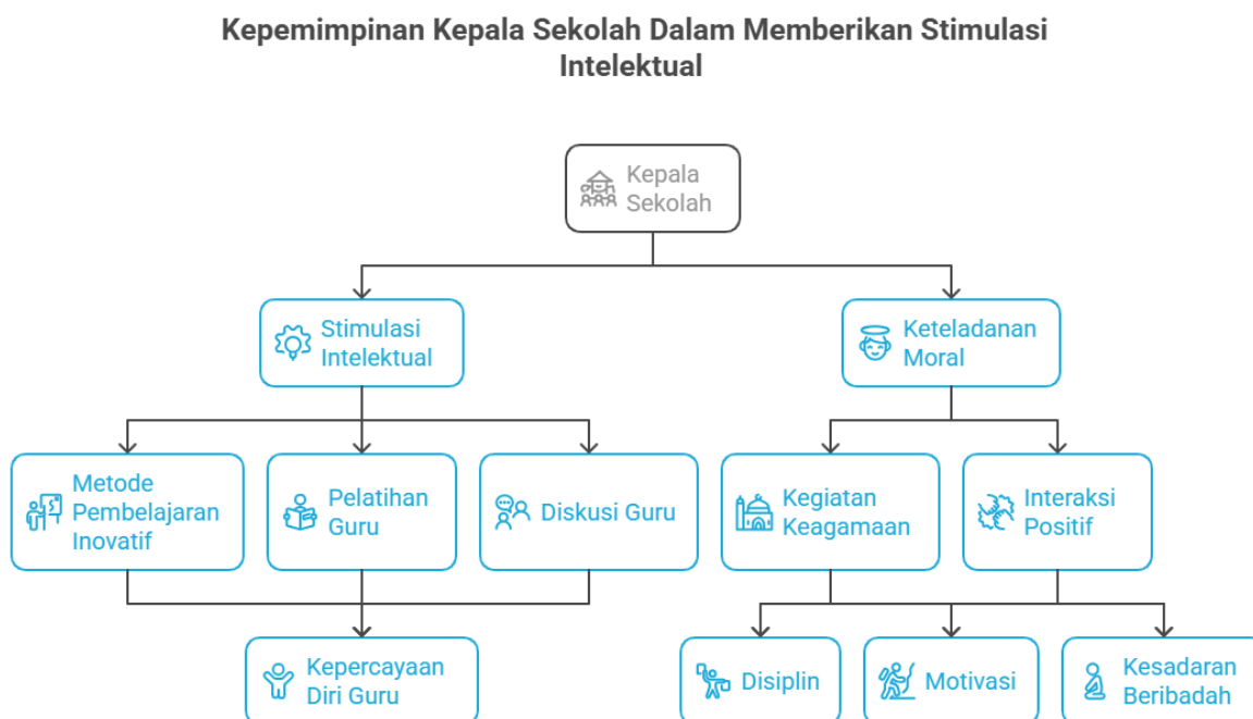
Gambar 2. Kepemimpinan kepala sekolah dalam memberikan stimulasi intelektual di SDN 88 Barru

Kepala sekolah berperan aktif dalam memberikan stimulasi intelektual dengan mendorong guru mengembangkan metode pembelajaran inovatif. Selain itu, kepala sekolah memfasilitasi pelatihan serta membuka ruang diskusi bagi guru untuk berbagi pengalaman dan strategi pembelajaran. Dengan pendekatan ini, guru lebih percaya diri dalam menerapkan metode yang efektif, sementara siswa mendapat pengalaman belajar yang lebih interaktif dan menarik. Berdasarkan data informan dan hasil observasi peneliti yang melihat bahwa kepala sekolah mempengaruhi bawahan atau guru dengan berorientasi keteladanan dan nilai-nilai moral. Kepala sekolah turut andil dalam pelaksanaan sholat dan kegiatan keagamaan di sekolah. Kepala sekolah SD Negeri 88 Barru menjadi sosok yang menginspirasi bagi guru dan siswa dengan memberikan teladan dalam menjalankan nilai-nilai keagamaan dan membangun kedekatan melalui interaksi yang positif. Keterlibatan langsung dalam shalat berjamaah, kerja bakti, serta berbagai kegiatan sekolah menunjukkan komitmen beliau dalam membentuk budaya akademik dan budaya kebersamaan di sekolah. Hal ini memberikan dampak positif terhadap peningkatan disiplin, motivasi, serta kesadaran beribadah bagi guru dan siswa. Untuk lebih jelas hasil penelitian dapat dilihat pada gambar 2 berikut: