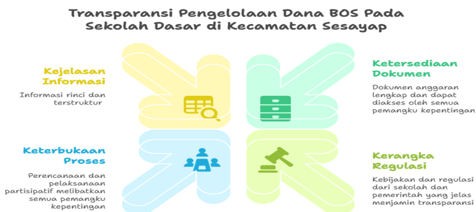
Gambar 1. Transparansi Pengelolaan Dana BOS pada Sekolah Dasar di Kecamatan Sesayap

Berdasarkan hasil penelitian ditemukan bahwa transparansi pengelolaan Dana BOS pada Sekolah Dasar di Kecamatan Sesayap ditentukan oleh empat aspek utama, yaitu kejelasan informasi, keterbukaan proses, ketersediaan dokumen, dan kerangka regulasi. Untuk lebih jelas dapat dilihat pada gambar berikut: