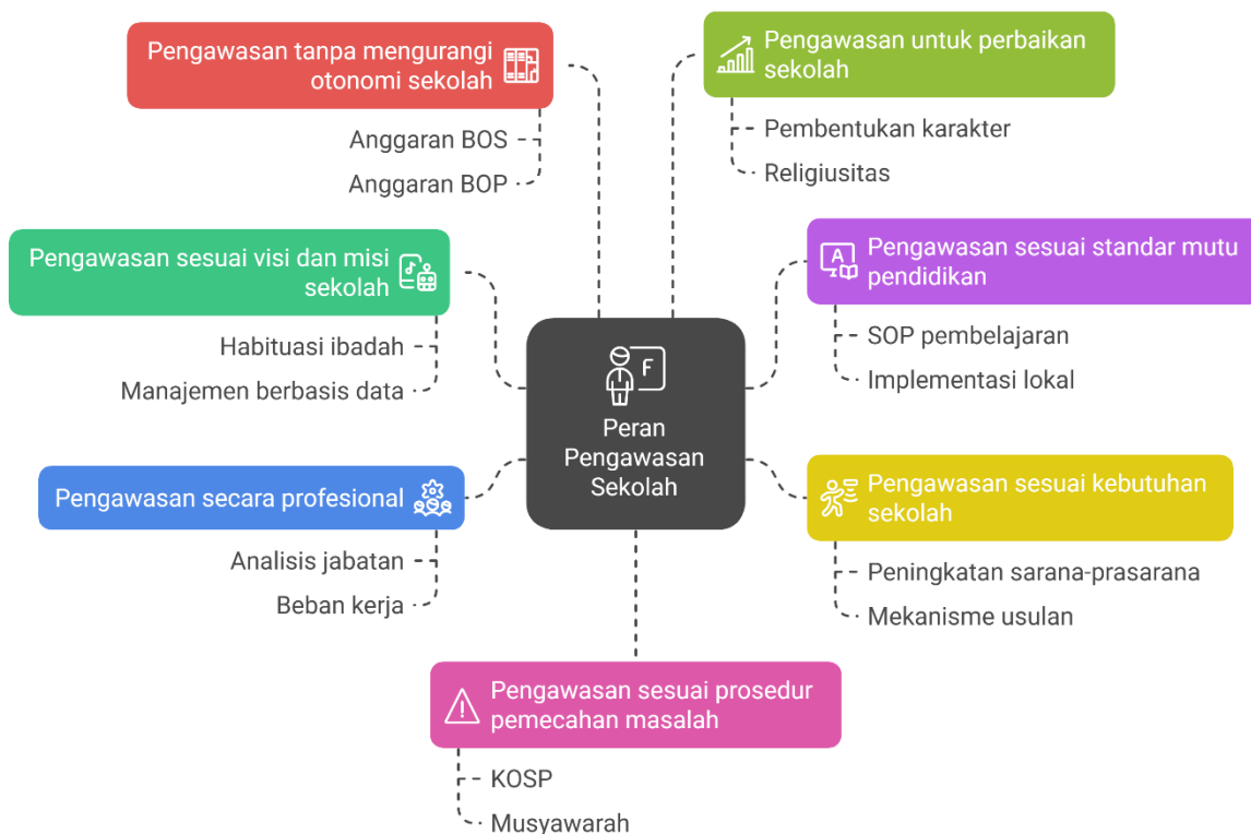
Gambar 2. Peran Pengawas Sekolah Petama di Kabupaten Tanah Tidung