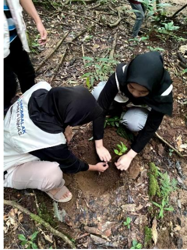
Gambar 2. Penanaman Pohon

Selain kegiatan tersebut, Modul Nusantara juga dilaksanakan melalui kegiatan penanaman pohon di Hutan Pendidikan Universitas Hasanuddin. Kegiatan ini melibatkan mahasiswa secara langsung dalam aktivitas pelestarian lingkungan. Mahasiswa bersama-sama menanam bibit pohon sebagai bentuk kontribusi nyata terhadap upaya menjaga kelestarian alam. Kegiatan ini menghadirkan pengalaman belajar yang berbeda, karena mahasiswa tidak sekadar menerima penjelasan, tetapi juga berpartisipasi aktif dalam aktivitas yang berdampak langsung. Melalui kegiatan penanaman pohon, mahasiswa belajar memahami bahwa kepedulian terhadap lingkungan tidak hanya cukup pada tingkat pemahaman, tetapi perlu diwujudkan dalam tindakan nyata.