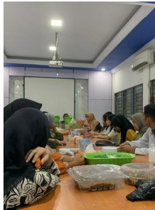
Gambar 3. Rapat dan Diskusi bersama KEMASOS

Selain kegiatan luar kampus, banyak mahasiswa PMM juga memilih untuk bergabung dengan Unit Kegiatan Mahasiswa (UKM) atau organisasi kemahasiswaan di kampus tujuan. Keterlibatan ini menjadi hal penting untuk berinteraksi lintas budaya dan memperluas jaringan sosial. Mahasiswa belajar mengenal sistem kerja organisasi yang berbeda, beradaptasi dengan pola komunikasi baru, serta memahami nilai-nilai kolektif yang berlaku di lingkungan kampus tujuan.