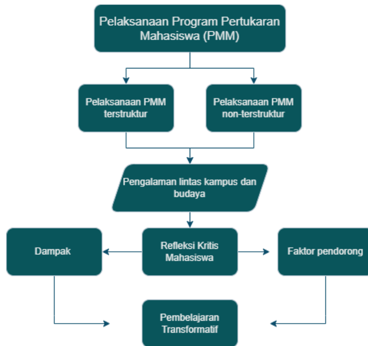
Gambar 5. Alur Keberhasilan Pembelajaran Transformatif

Bagan tersebut menggambarkan bahwa pelaksanaan Program Pertukaran Mahasiswa Merdeka terdiri atas dua bentuk utama, yaitu kegiatan terstruktur dan non-terstruktur. Kedua bentuk pelaksanaan tersebut menghadirkan pengalaman belajar lintas kampus dan lintas budaya yang menjadi pemicu utama munculnya refleksi kritis mahasiswa. Proses refleksi kritis tersebut menjadi elemen kunci dalam pembelajaran transformatif, karena melalui refleksi mahasiswa membangun pemaknaan baru terhadap pengalaman yang dialami. Refleksi ini kemudian berkontribusi terhadap munculnya berbagai dampak, seperti perubahan cara pandang, peningkatan kemampuan adaptasi sosial, serta berkembangnya kesadaran terhadap keberagaman. Di sisi lain, proses tersebut juga dipengaruhi oleh faktor pendorong, baik yang berasal dari struktur program maupun kapasitas mahasiswa sebagai agen reflektif. Dengan demikian, pembelajaran transformatif dalam Program PMM terbentuk melalui hubungan yang saling berkaitan antara pengalaman, refleksi, dan konteks sosial yang melingkupinya.