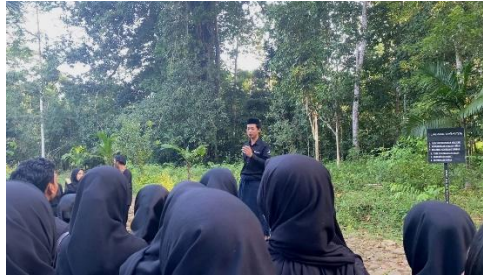
Gambar 1. Kegiatan Modul Nusantara dalam kunjungan ke Kawasan Adat Suku Kajang

wilayah kampus tujuan. Modul ini dilaksanakan di luar jadwal perkuliahan utama, biasanya pada akhir pekan, dengan serangkaian kegiatan yang telah direncanakan oleh dosen fasilitator atau disebut sebagai dosen modul nusantara. Setiap dosen memiliki rencana kegiatan yang sistematis, kurang lebih sama seperti rencana pembelajaran, namun lebih bersifat eksploratif dan partisipatif.