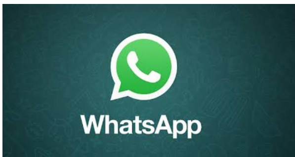
Gambar 1. Logo WhatsApp

WhatsApp adalah sebuah aplikasi yang dapat digunakan untuk chatting yang biasanya tersedia di Smartphone yang dapat memungkinkan penggunanya untuk berbagi gambar dan pesan. WhatsApp adalah salah satu aplikasi pesan seluler yang memungkinkan untuk bertukar pesan tanpa harus membayar SMS, ini dikarenakan aplikasi WhatsApp memakai paket data internet. (Elianur, 2017). WhatsApp memiliki beberapa fitur yang dapat memudahkan penggunanya dalam melakukan komunikasi dengan orang lain. Fitur tersebut diantaranya yaitu: